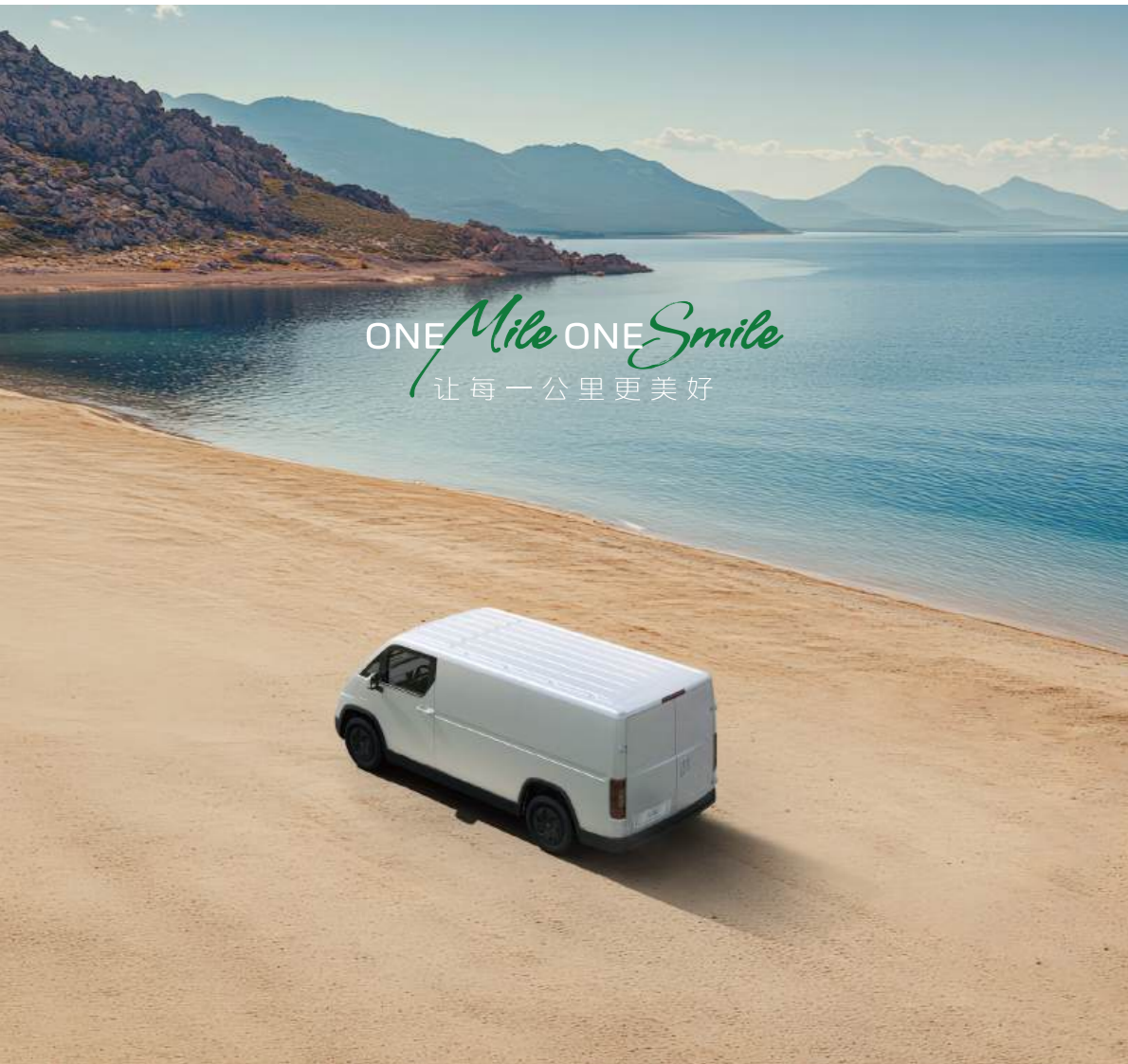
26款乐福-乐版-6.2版 配置表